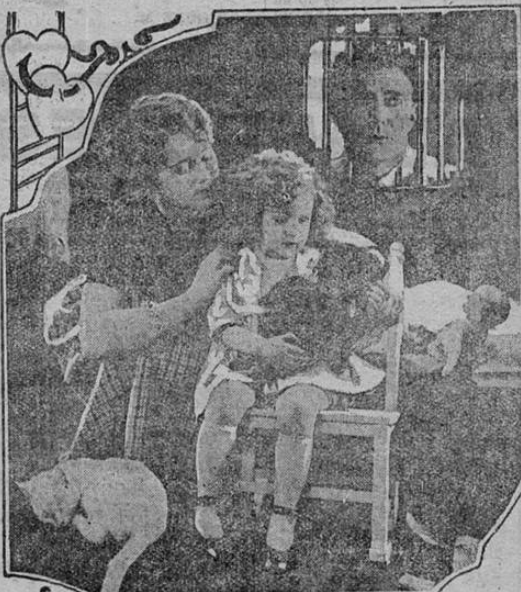
HOUSE PETERS with a Big Special Cast, in "HUMAN HEARTS" A Universal Jewel